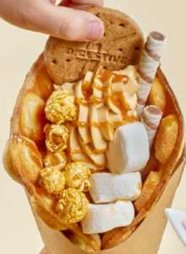
Вафля «Карамельный Бум»