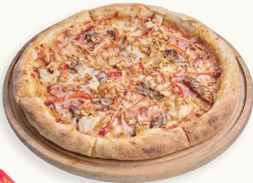
Пицца мясная 620 р.