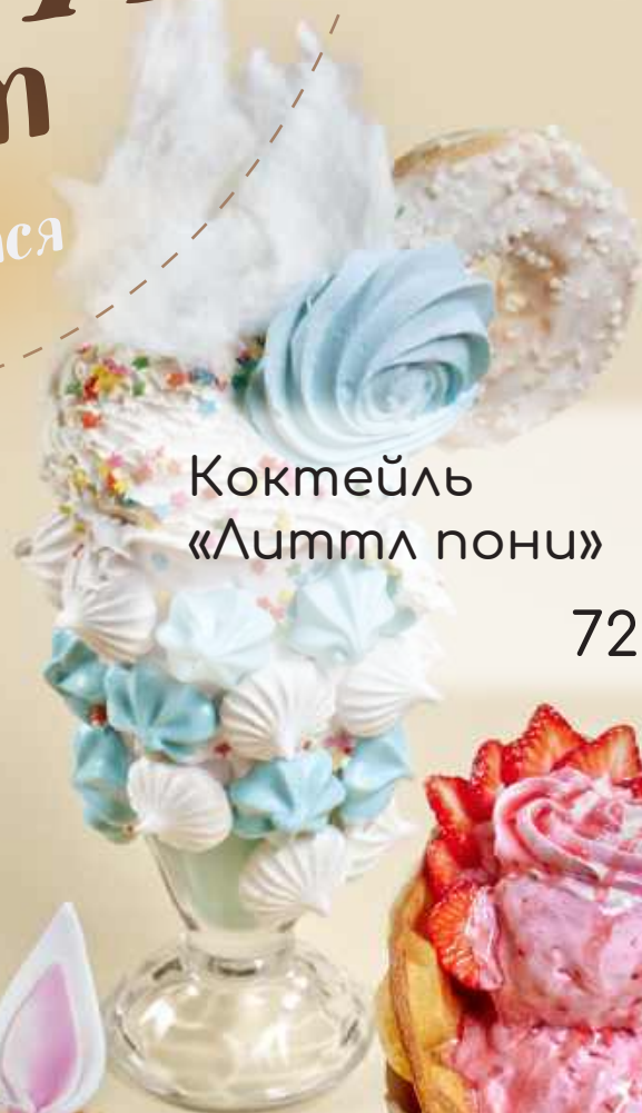
Коктейль «Литтл пони»