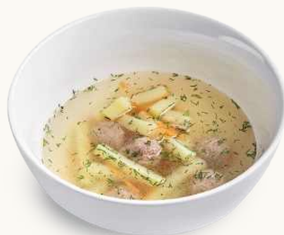
Супчик с фрикадельками 280 р.