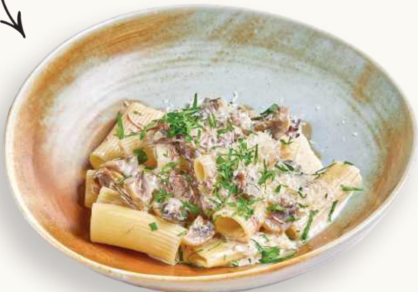
Ризатони Том-Ям 690 р.