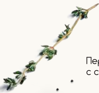
Перцы печёные с сыром фета