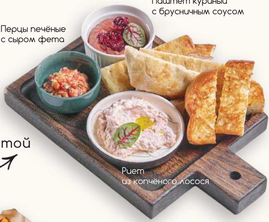
Ассорти дипов с пивой