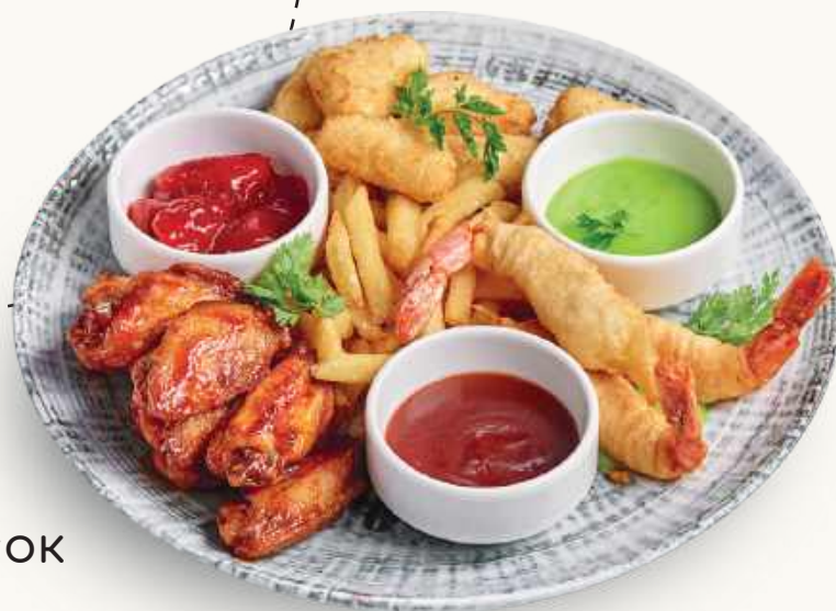
Ассорти из горячих закусок 1490 р.