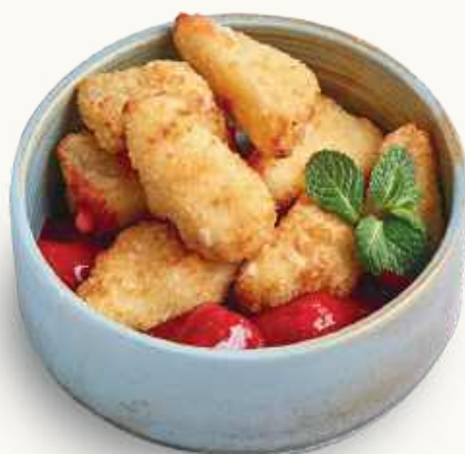
Сулугуни с ягодным соусом 410 р.