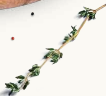
Пицца с грибами и ароматом трюфеля 640 р.