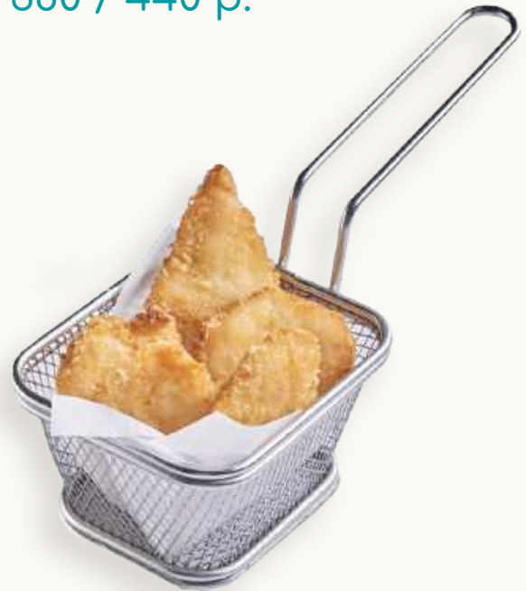
Куриные ноггетсы 330 р.