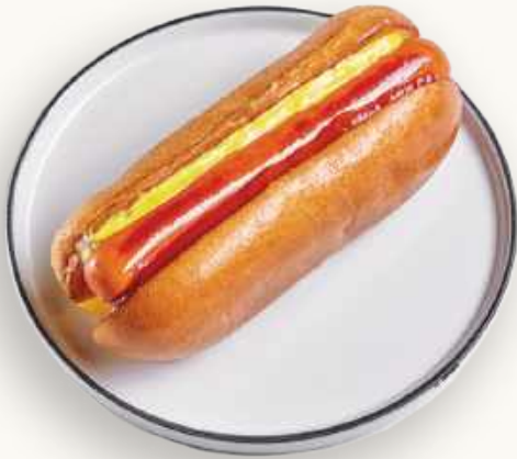
«BOOM kids» Хот-дог 380 р.