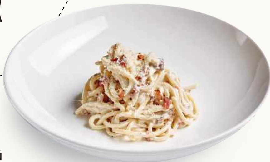
Ризатони с щёчками / с курицей 560 р. / 480 р.