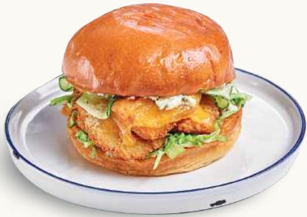
Мини чикенбургер/ бургер с говядиной 380 / 440 р.