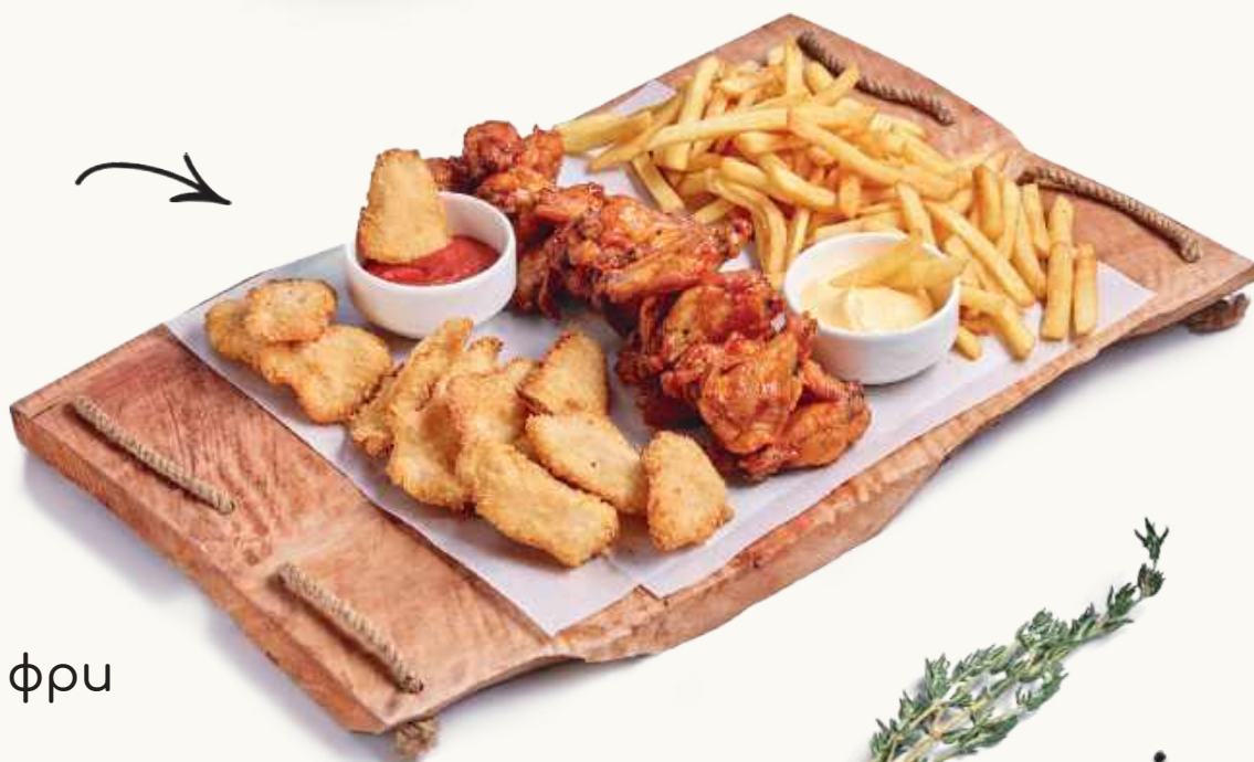
Картофель фри 240 р.