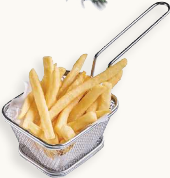
Картофель фри 240 р.