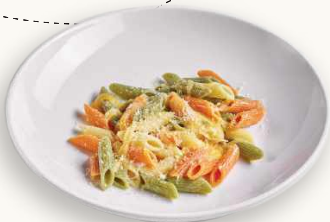
Макаронны с сыром 240 р.